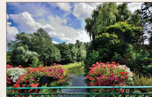
L'Avre à Castel

totallement détruits : sur 1 014 habitations, neuf seulement furent classées réparables. La ville a été décorée de la croix de guerre 1914-1918, le 30 octobre 1920.