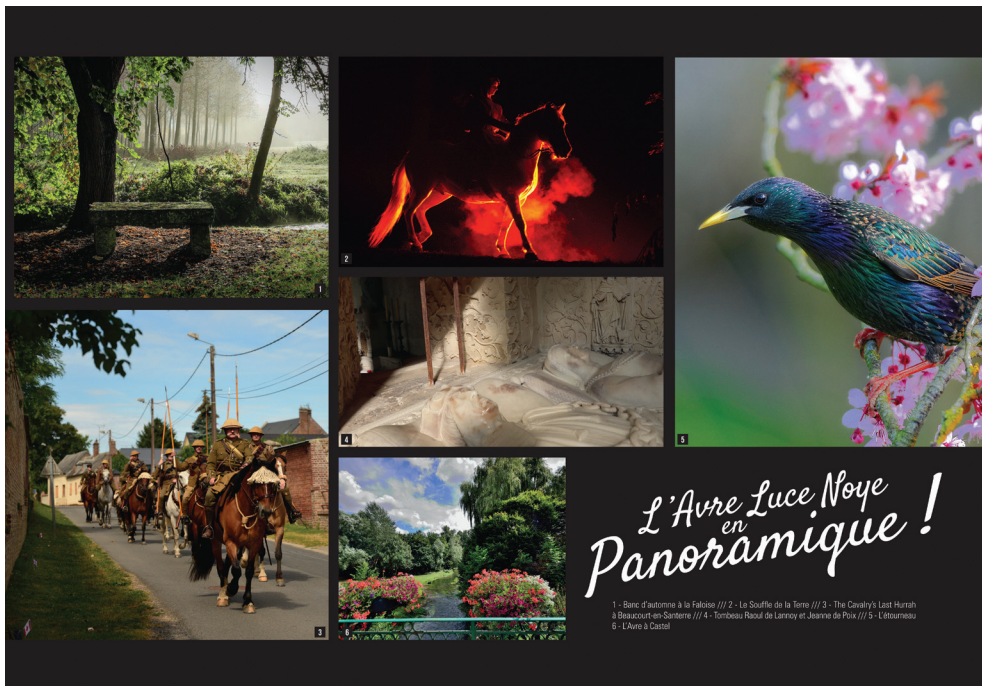
1 - Banc d'automne à la Falaise // 2 - Le Souffle de la Terre // 3 - The Cavalry's Last Harsh at Beaucourt-en-Santerre // 4 - Tombeau Raoul de Lennoy et Jeanne de Poix // 5 - L'étourneau // 6 - L'Avre à Castel